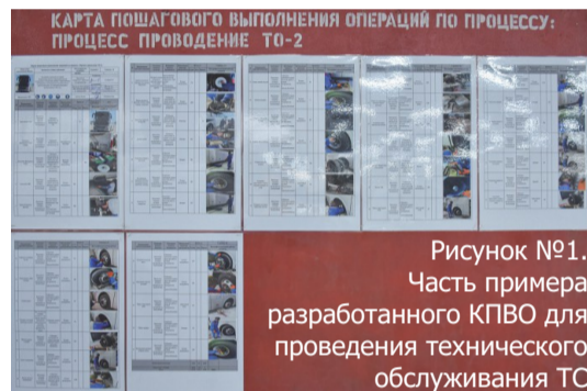
Рисунок №1. Часть примера разработанного КПВО для проведения технического обслуживания ТС

Это произошло благодаря обучению и вовлечению владельцев процессов, что подтверждает их заинтересованность в дальнейшем применении этой методики. Создание рабочих групп для разработки КПВО на всех участках - важный шаг для продвижения этой стратегии на предприятии."