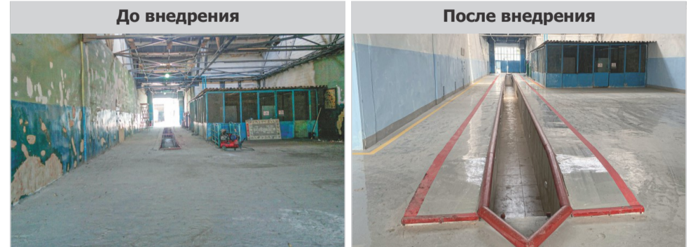
Рисунок №4. Идея удлинить смотровую яму для размещения более 1-го транспортного средства. Производительность рабочего места увеличилось 2-хкратно

Нам важно, чтобы каждый член нашей команды почувствовал свою важность в слаженной системе «Кайдзен». Мы демонстрируем, как творческая энергия рационализаторов становится силой многотысячного коллектива. Около четверти предложений, поступающих от рядовых работников, технического характера, но наши бланки также включают улучшения в условиях и безопасности труда, контроле процесса, экономии ресурсов, передаче информации и создании имиджа компании.