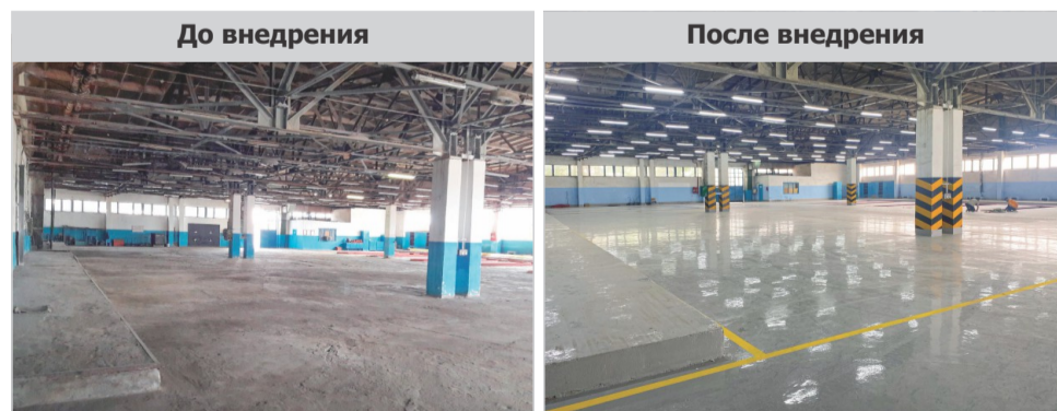
Рисунок №3. Залили надежное напольное покрытие

Для увеличения производительности и переориентации мышления сотрудников на принципы бережливого производства, мы заменили неудобные верстаки на инструментальные стенды. Они способствуют быстрому и удобному доступу к инструментам и комплектующим.