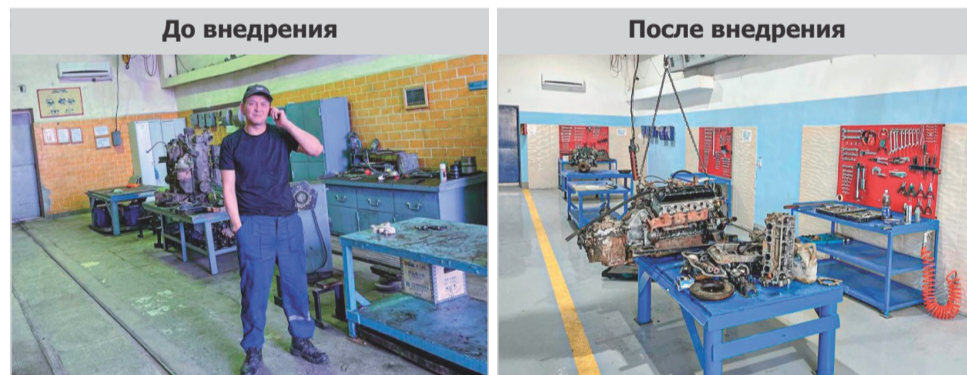
Рисунок №2. Внедрение шагов 1S, 2S согласно системе 5S в «Моторном отделении»

Для стандартизации рабочих мест мы успешно применяем систему 5S, являющуюся ключевым инструментом бережливого производства. Она представляет собой пять простых принципов организации рабочего пространства, включая сортировку, самоорганизацию, систематическую уборку, стандартизацию и постоянное совершенствование. Эти принципы позволяют извлекать максимальную выгоду из имеющихся ресурсов и значительно улучшают производственные процессы. Мы выбрали «Моторное отделение» в качестве пилотного проекта.