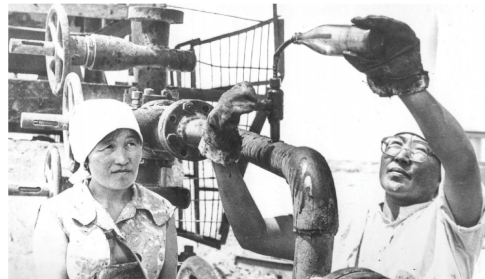
Ұңғымадан сынама жинау