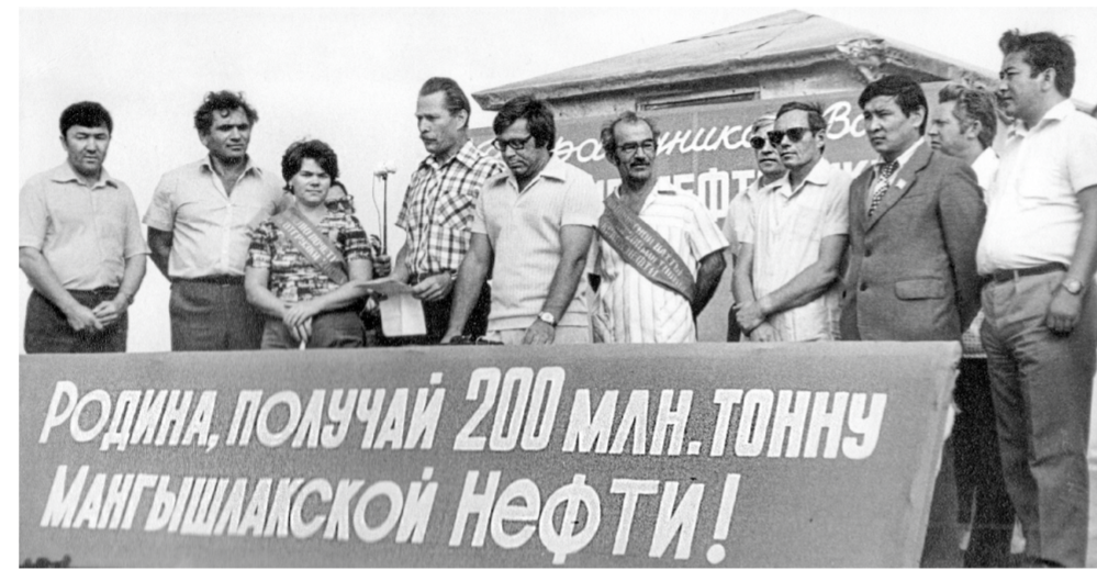
1981 жылдың 10 тамызында маңғыстаулық мұнайшылар 200 миллион тонна «қара алтын» өндіруге қол жеткізді.