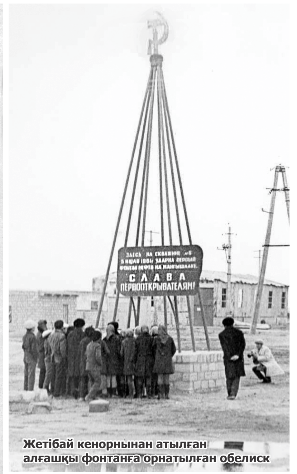
Жетібай кенорнынан атылған алғашқы фонтанға орнатылған обелиск