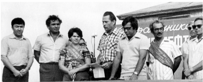
РОДИНА, ПОЛУЧАЙ 200 МЛН ТОНН МАНГЫШЛАКСКОЙ НЕФТИ