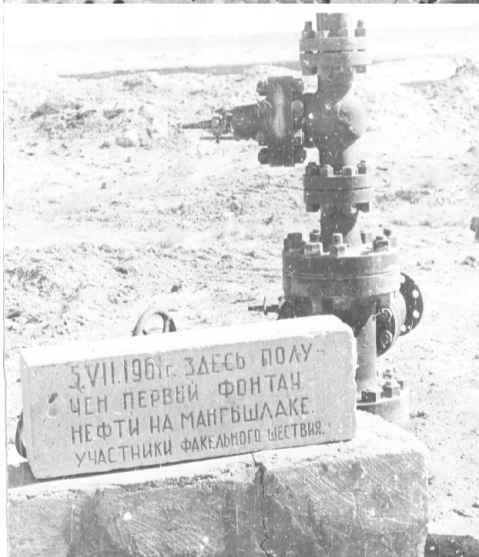
5.VII.1961г. ЗДЕСЬ ПОЛУЧЕН ПЕРВЫЙ ФОНТАН НЕФТИ НА МАНГЫШЛАКЕ. УЧАСТНИКИ ФАКЕЛЬНОГО ШЕСТВИЯ.

60 ЖЫЛ БҰРЫН – 1961 ЖЫЛДЫҢ 5 ШІЛДЕСІНДЕ МАҢҒЫСТАУДА МҰНАЙДЫҢ АЛҒАШҚЫ БҰРҚАҒЫ АТТЫ