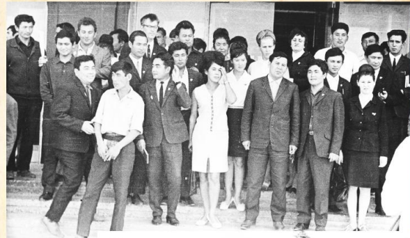
Группа участников Слета молодых нефтяников, сост. в 1968 г. в г. Мелеченко