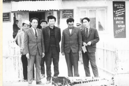
Первые инженерно-технические работники нефте-промышленного управления