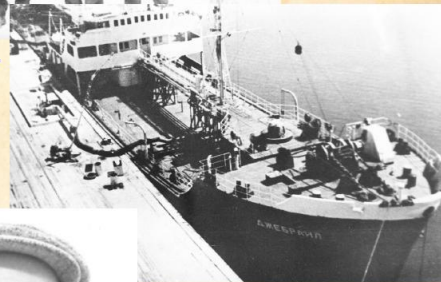
Отправка танкера Джебрак в октябре 1966 г.