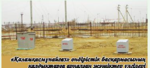
«Қазақстан мұнайгаз» өндірістік басқармасының қалдықтары арналған жинақтар үлгілері

Қалдықтардың меншік несі барлық кәуіпті қалдықтар үшін төлқұжат (паспорт) рәсімдеуге міндетті. Кәуіпті қалдықтар төлқұжаттары мемлекеттік тіркелуге жолданады. Кәуіпті қалдықтар меншік несі кәуіптілік қасиеттеріне қарасты, кәуіпті қалдықтардың буысын таңбалауы қамтамасыз етуге тиіс. Мұндай қалдықтарды