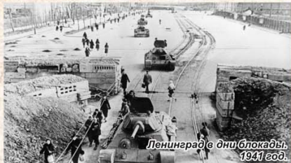
Ленинград в дни блокады. 1941 год.

В составе Советских Вооруженных сил под Ленинградом сражались пять стрелковых бригад и три авиационных полка из Казахстана.