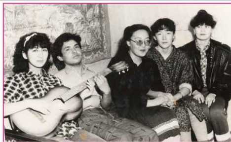
Мұнайшы кенті, №6 жатақхана, 1986 жыл.