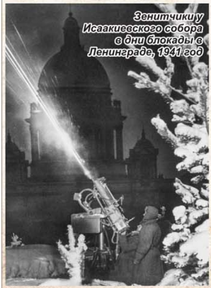
Зенитчики Исаакиевского собора в дни блокады в Ленинграде, 1941 год.

Блокада города и варварские обстрелы продолжались 900 дней и ночей, месяц за месяцем бомбили немецкие самолеты дома, площади, улицы Ленинграда осадной артиллерией, бронепоездами, авиацией. За это время они обрушили на город свыше 100 тысяч фугасных и зажигательных авиабомб, выпустили около 150 тысяч снарядов, не было дня, чтобы не горело какое-либо здание.