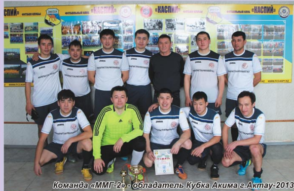
Команда «ММГ-2» - обладатель Кубка Акима г.Актау-2013

Новый сезон 2014 года для футбольных команд мангистауского региона стартовал 7 января турниром за «Суперкубок Четырех». Данный турнир был организован впервые в истории мангистауского футбола, где в финале встречались между собой победитель и обладатель кубка в каждой из лиг – высшей, первой, второй и третьей. В данном турнире участвовали и обе наши команды.