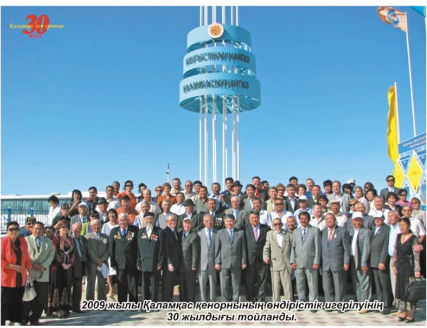
2009 жылы Қаламқас кенорының өндірістік ішкерлігінің 30 жылдығы тойланды.