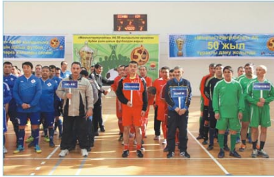
Алғашқы мерекелік шара - аймақтағы мұнайшы компаниялар арасында ұйымдастырылған шағын футболдан бастады.

«Маңғыстаумұнайгаз» АҚ-ның 50 жылдығына арналған турнирде сексенге жуық кара алтын өндірушілер сегіз командаға бөлініп мықтауларды анықтады. Әр ұжымның жеңіске деген құшмысы зор болды. Мұнайшылар кәсіпқой футболшы болмаса да, ойын өрнегін аяқ доп шеберіне тән жігер байқалып тұрды. Әр ойын сайан әдемі голдар соғылып, жаңкуйерлер желініп қалды. Жарыс қорытындысында 1-орынды «Каспий» ФК, 2-орынды «Мобил Сервис», 3-орынды «БарсОй» командалары қанжығаларына байлап, бағалы сыйлықтармен марапатталды.