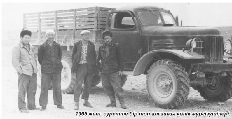
1965 жыл, суретте бір топ алғашқы көлік жүргізушілері.

Сонау 1964 жылы іргесін құрған «Маңғышлақнефть» Бірлестігінің автокөлік кеңсесі (АТК) негізінде өлкеміздің мұнай саласына қызмет көрсететін көптеген автокөлік мекемелері тараған болатын, олар: №3-ші Өзен автокөлік тізбегі, №1,2,3 Тракторлық база, Тампоаж кеңсесінің гаражи, Жұмысшыларды тамақпен қамту бөлімінің гаражи,