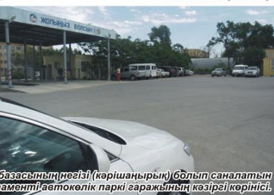
«Маңғыстаумұнайгаз» автокөлік базасының негізі (көрішарырық) болып саналатын Ақтау қаласы 22-ші/а орналасқан Көлік департаменті автокөлік паркі гаражының кәзіргі көрінісі.