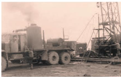
Үстіміздегі жылдың маусым айында «Маңғыстаумұнайгаз» автокөлік базасының негізін қаланғанына ЖАРТЫ ҒАСЫР болып, бұл мереке тамыз айының 1-ші жұлдызында атап өтілгені жоспарланып отыр.

Сонау 1964 жылы іргесін құрған «Маңғышлақнефть» Бірлестігінің автокөлік кеңсесі (АТК) негізінде өлкеміздің мұнай саласына қызмет көрсететін көптеген автокөлік мекемелері тараған болатын, олар: №3-ші Өзен автокөлік тізбегі, №1,2,3 Тракторлық база, Тампоаж кеңсесінің гаражи, Жұмысшыларды тамақпен қамту бөлімінің гаражи,