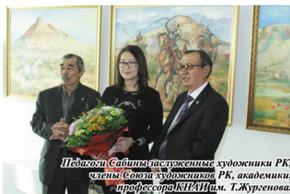
Педагоги Сабина заслуженные художники РК, члены Союза художников РК, академики, профессор КНИИ им. Т.Жургенова.

Гостям выставки очень понравилась картина «Качели любви». - Такие чистые и свежие краски, такие прелестные юные лица. Мне