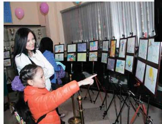
Байқауға 4 жас пен 12 жас аралығындағы балалардың салған қырыққа жуық туындысы қатысты. Бірі түрлі-түсті қарындашпен кескілессе, екіншісі бояумен әрлеп, қиялдарын қағаз бетіне түсірді. Байқау қорытындысы, жас шамалары

"Бала - көңілдің гүлі, көздің нуры", "Балалы үй - базар, баласыз үй - мазар", "Бала тілі балдан тәтті" деп, кейде тіпті балаларымыздың пәктігіне, көңілінің адалдығы мен жүрегінің тазалығына тамсанып, періштеге теңей жатамыз. Мұндай мақал-мәтелдер тізбегін шексіз жалғастыра беруге болатын секілді.