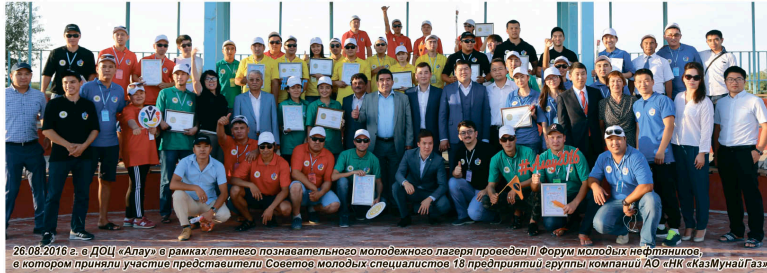
26.08.2016 г. в ДОО «Алау» в рамках летнего познавательного молодежного лагеря проведен II Форум молодых нефтяников, в котором приняли участие представители Советов молодых специалистов 18 предприятий группы компаний АО «КазМунайГаз»