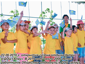
02.06.2016 г. открытие сезона отдыха детей в ДОО «Алау». В 2016 году около 2000 детей работников Общества отдохнули в ДОО «Алау»