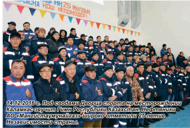
14.12.2016 г. Под сводами Дворца спорта на Месторождении Каламкас звучит Гимн Республики Казахстан, Нефтяники АО «Мангистаумунайгаз» широко отметили 25-летие Независимости страны.