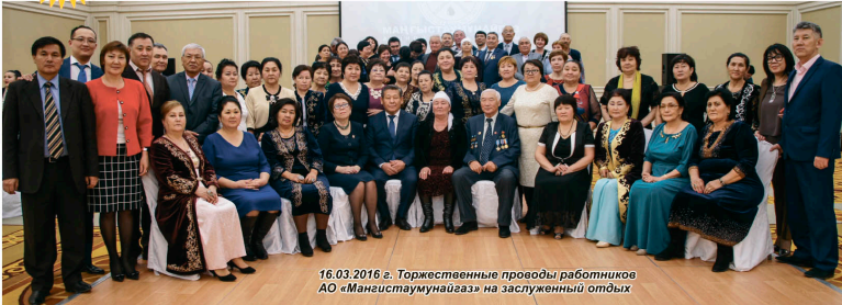
16.03.2016 г. Торжественные проводы работников АО «Мангистаумунайгаз» на заслуженный отдых