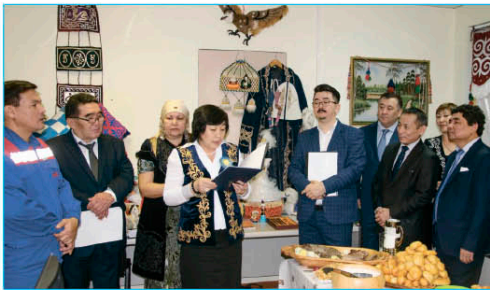
мереке алды көңіл-күй сыйлағаны рас.

атаның салтын, ананың тілін сақтап қалған қазақ ауылына түскендей сезімде болдық. Бөлменің төріне тігілген киіз үйдің керегесі, төселген оюлы киіз, жұқаяқ, сандық, текеметтер, шашбау шылдырлап шашағы жерге төгілген орнамады қыз-келіншектердің ұсынған ағарғаны мен ұлттық мәзіріміз сол бір әсерімізді еселей түсті. Ауа толтырылған шарларға ілініп, төбеле жейі қалықтап тұрған 25 жылдықтың басты оқиғалары кескінделген фотосуреттер, Тәуелсіздіктің құрдасы Нұрсұлтан