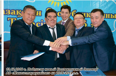
13.02.2016 г. Подписан новый Коллективный договор АО «Мангистаумунайгаз» на 2016-2019 гг.