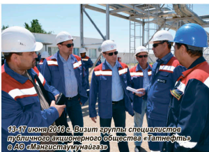
18-19 июня 2016 г. Визит группы специалистов публичного государственного предприятия «Латифет» АО «Мангистаумунайгаз»