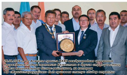
29.09.2016 г. в Алматы прошла XXVIII международная церемония награждения лидеров экономики Казахстана в области спартакиады (Союз) национальных бизнес-райтингов, на которой АО «Мангистаумунайгаз» был присвоен статус «Лидер отрасли»