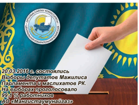
20.03.2016 г. состоялась Выбора депутатов Мажилиса Парламента и маслихатов РК. На выборах проголосовало 99 112 работников АО «Мангистаумунайгаз»