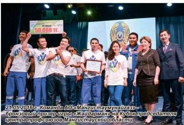
21.05.2016 г. Команда АО «Мангистаумунайгаз» – бронзовый призер игры «Жайдарман» на Кубок председателя центра профсоюзов Мангистауской области