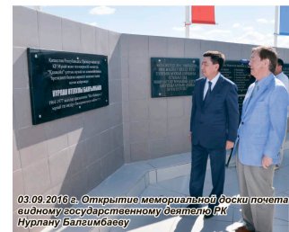
03.09.2016 г. Открытие мемориальной доски почета видному государственному деятелю РК Нурлану Балгимбаеву