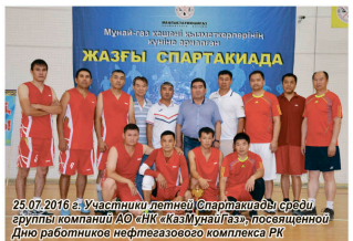
25.07.2016 г. Участники летней спартакиады среди групп компаний АО НК «КазМунайГаз» посетили День работников нефтяного комплекса РК