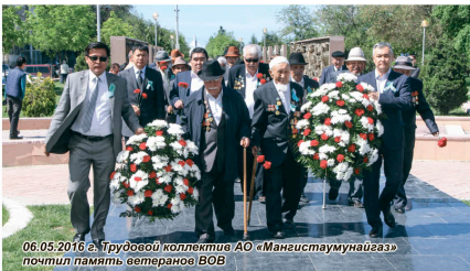
06.05.2016 г. Трудовой коллектив АО «Мангистаумунайгаз» почтит память ветеранов ВОВ