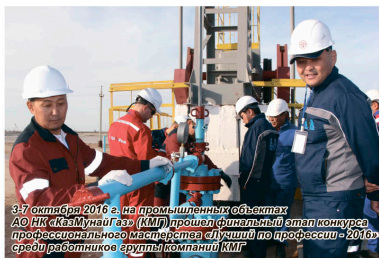
9-11 октября 2016 г. на призывный объект АО НК «КазМунайГаз» (КМГ) проведен финальный этап конкурса профессионального мастерства «Лучший по профессии - 2016» среди работников группы компаний КМГ