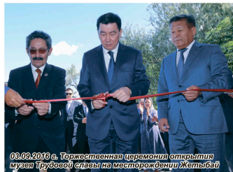
08.09.2016 г. Торжественная церемония открытия музея Трудовой славы на месторождении Жатыбай