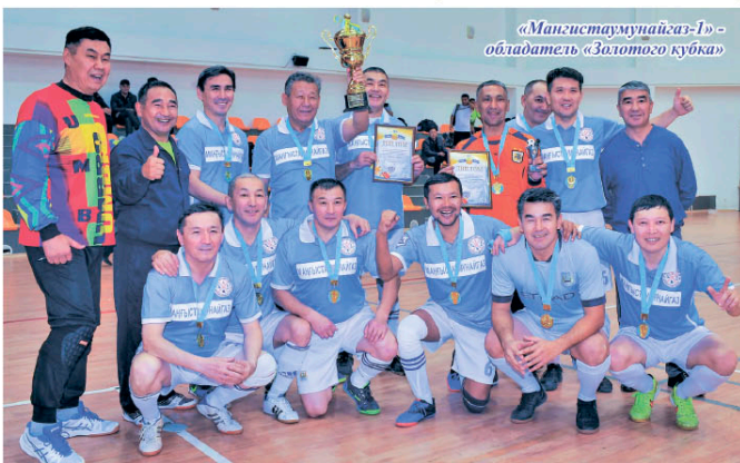
«Мангистаунайгаз-1» - обладатель «Золотого кубка»

Итак, обе наши команды вышли в финалы соревнований.