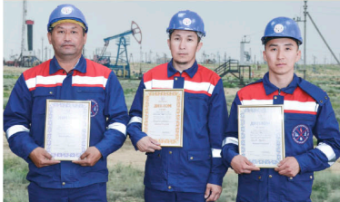
Победители конкурса «Лучший по профессии» в номинации «Токарь»