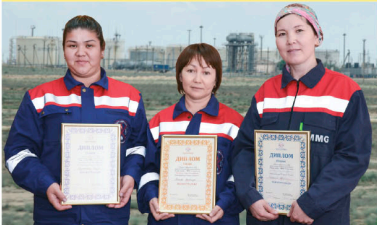
Победители конкурса «Лучший по профессии» в номинации «Сварщик»