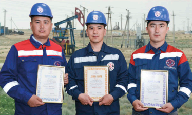
Победители конкурса «Лучший по профессии» в номинации «Оператор по исследованию скважин»