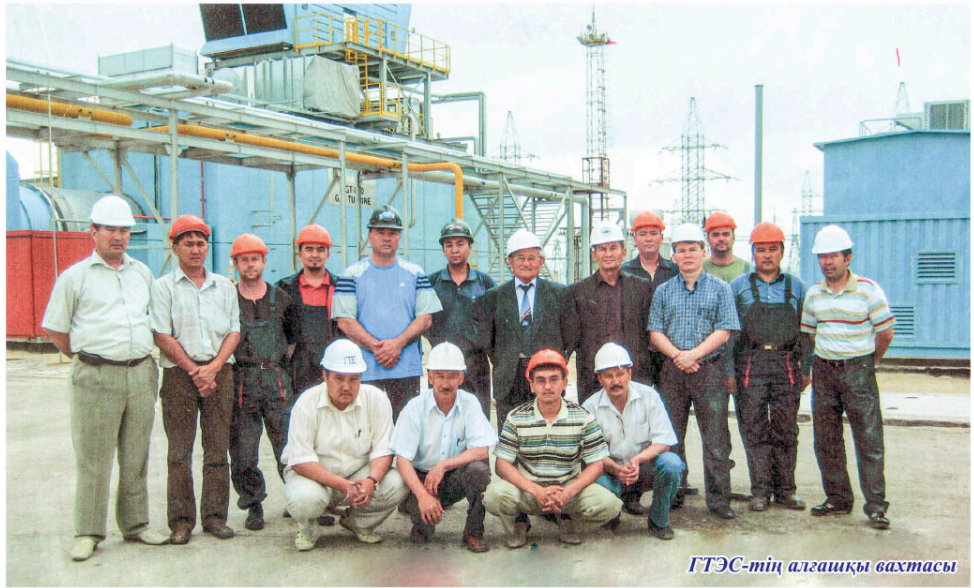
ГТЭС-тің алғашқы вахтасы