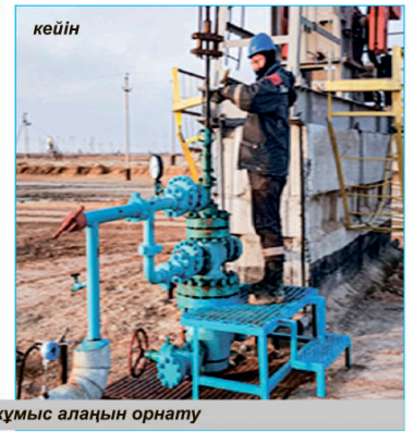
Қауіпсіз жұмыс алаңын орнату