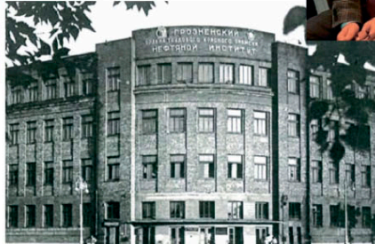
Старое здание института