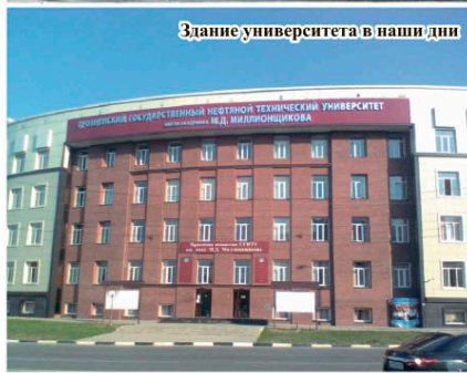
Здание университета в наши дни