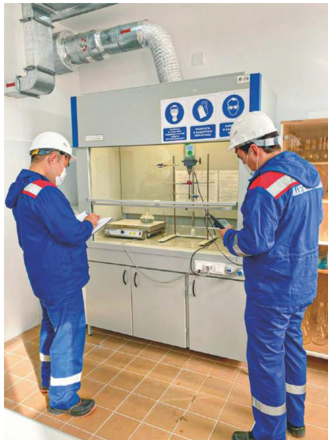
Вытяжная вентиляция предназначена для удаления отработанного воздуха.

Приточная вентиляция предназначена для обработки воздуха: его подогрев, охлаждение, очистка от пыли или увлажнение.