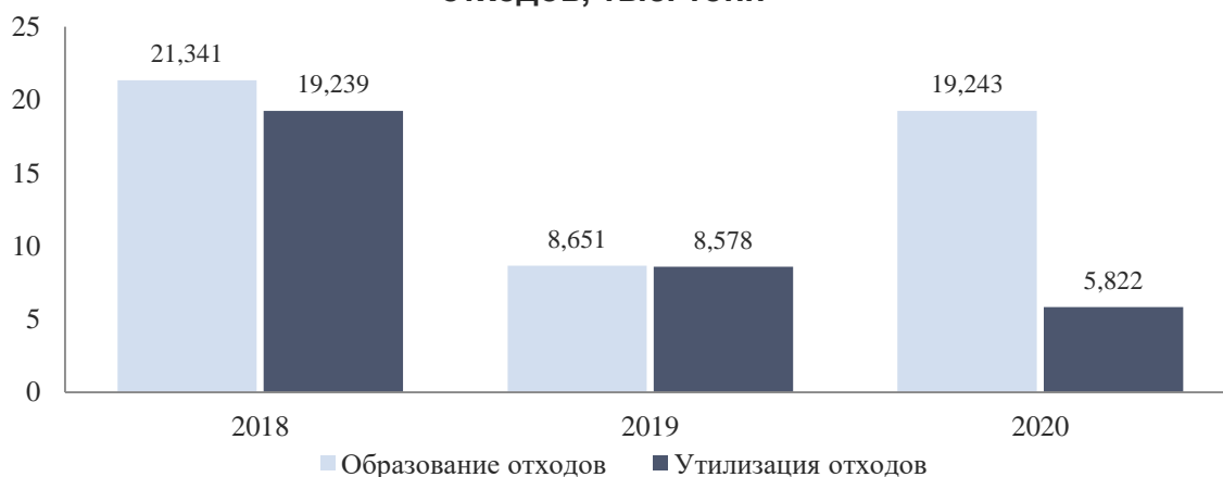
Статус утилизации/переработки вновь образованных отходов, тыс. тонн

В диаграмме представлен фактический статус утилизации/переработки новых образований отходов.